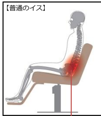
S字曲線が崩れると疲れや腰痛の原因に！！

脊柱アライメントとは背骨の配列です。人間の背骨は、横から見ると緩やかなS字曲線を描いています。背もたれがフラットなイスだと、座ると骨盤の角度が変わり、背骨が後方に湾曲してアーチ型になり、背中痛みや腰痛の原因となります。