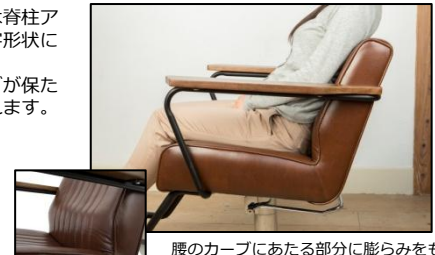
腰のカーブにあたる部分に膨らみをもたせ、背骨の配列に沿った形状にしました。

背もたれのクッションは脊柱アライメントに沿ったS字形状にしました。背骨の自然なS字カーブが保たれ、座り疲れが軽減されます。