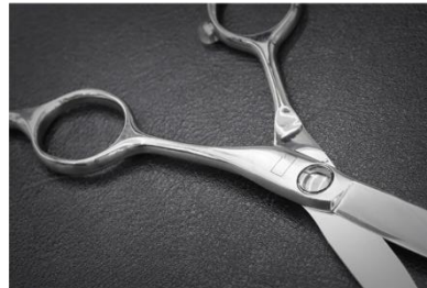
顔や耳の周りなどの繊細なカット、毛束感をつくるスライドカットにオススメですというシザー

LECOモデルはハンドルも細く、軽い。それによって刃先は安定感があり、指先で切る感覚で使えます。ショートヘアのカット、顔や耳の周りなどの繊細なカット、毛束感をつくるスライドカットにオススメです。